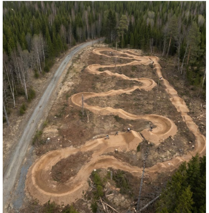
Så här kan hopp-området komma att se ut. Bilden är AI-genererad.

– Finns det pengar att söka, så söker man. Allt som byggs är ju byggt.